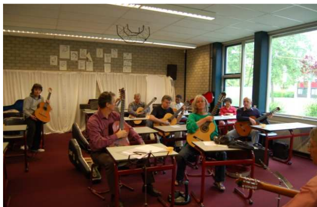
Enthousiaste deelnemende leden-gitaristen