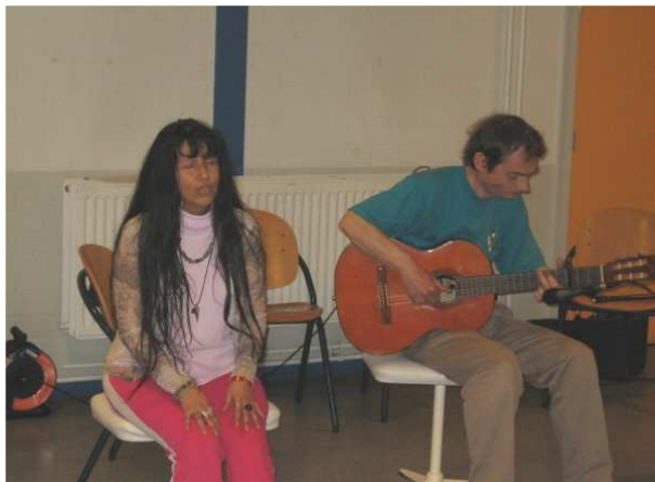
Duo Canela met Peruaanse liederen