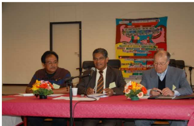
Het huidige bestuur van Pro Guitarra