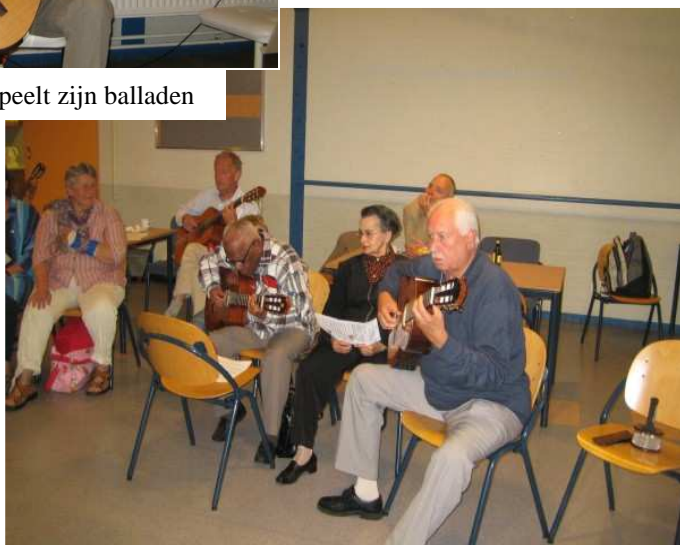
Vrolijk jammen op de gitaar