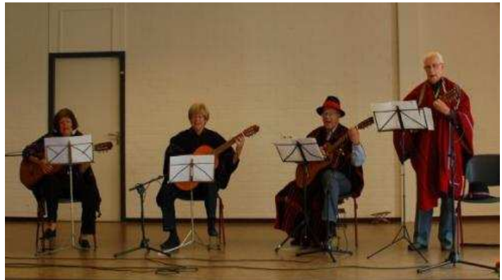
Kwartet "Machucuna" speelt Latijns-Amerikaanse muziek