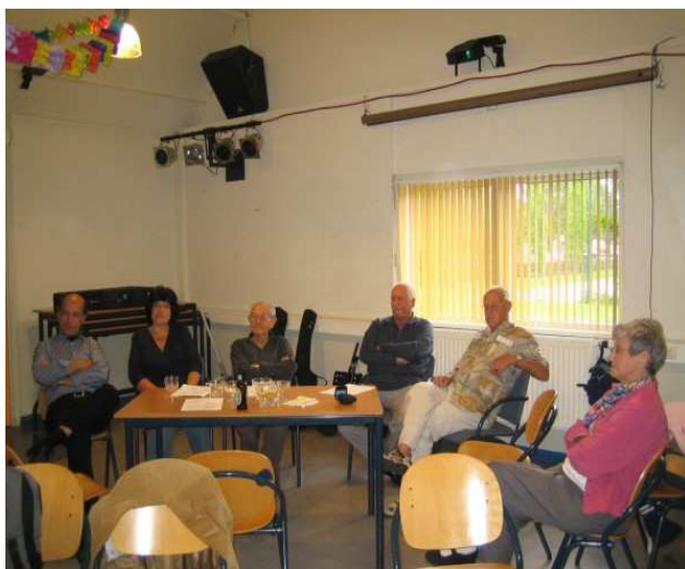
Kring van aandachtige luisteraars