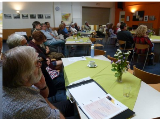
Ja, ja, de bezoekers en medeartiesten luisterden geboeid en genoten van de voordrachten.