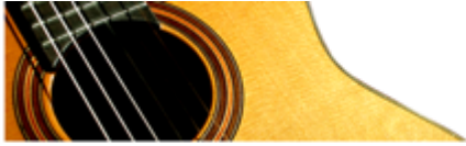
FOTO-verslag van de Algemene Leden Vergadering(ALV) en het Muziekprogramma op zaterdag 24 september 2016 te Den Haag