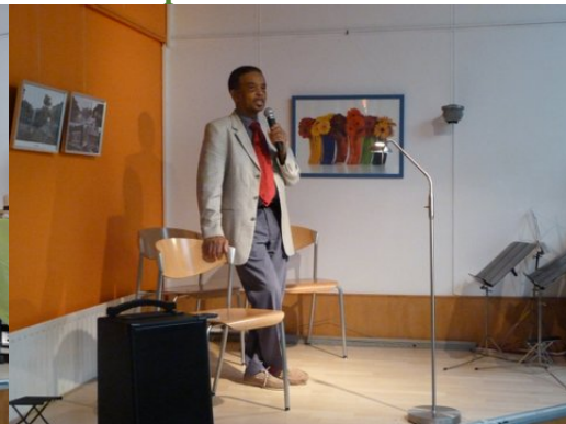
Otmar draagt voor uit eigen werk.